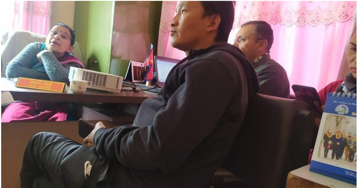
कार्यदल बैठक तथा सूचकहरुको स्वमापन